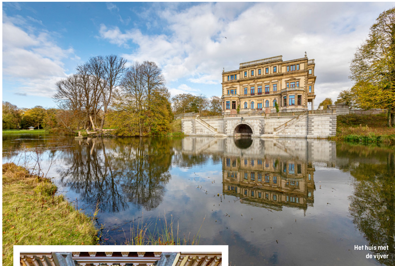
Het huis met de vijver