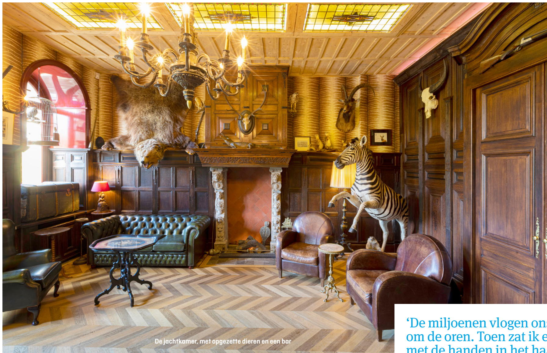
De jachtkamer, met opgezette dieren en een bar

In 1970 werd het gebouw aangekocht door de staat, die het in handen gaf van Staatsbosbeheer. Dat wilde er begin jaren negentig wel vanaf en schreef