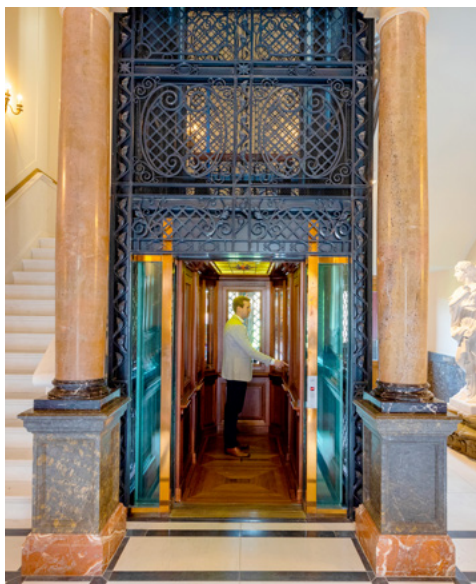
De enorme lift met handgemaakt smeedwerk

Maar had hij niet net een container vol Chinees spul gekocht? En zaten daar geen masieve, manshoge marmeren vazen in? Op naar China dus, in