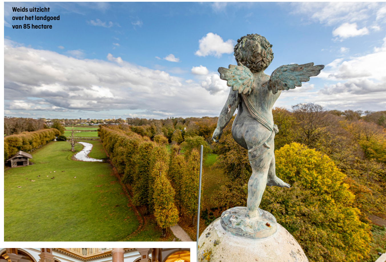
Weids uitzicht over het landgoed van 85 hectare