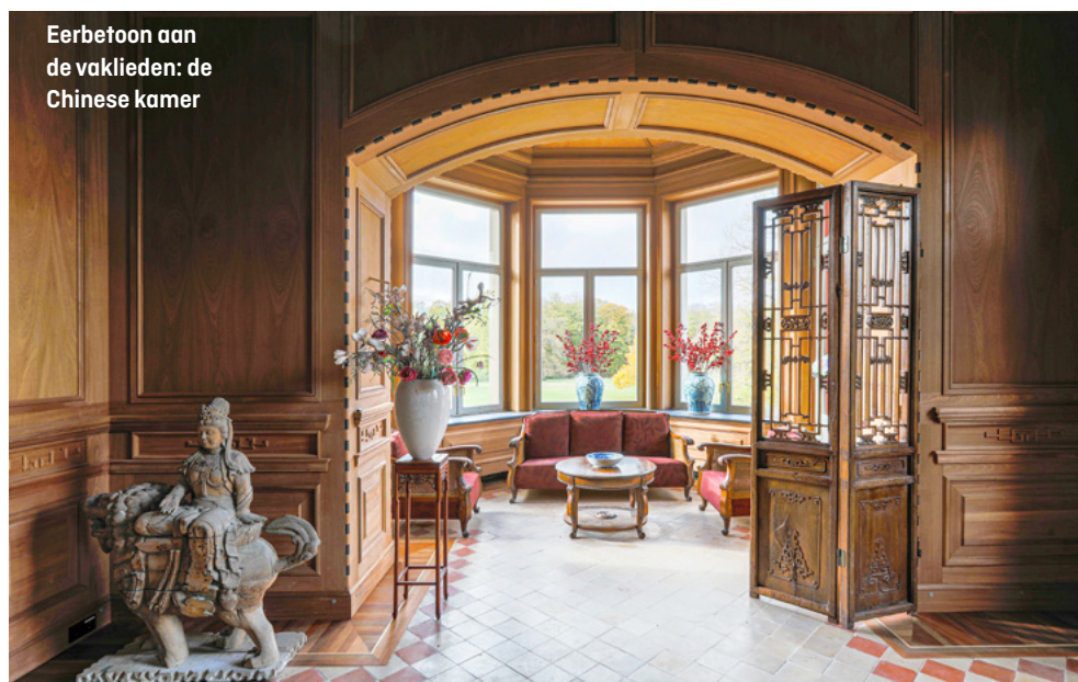
Eerbetoan aan de vaklieden: de Chinese kamer

‘De miljoenen vlogen ons om de oren. Toen zat ik echt met de handen in het haar’