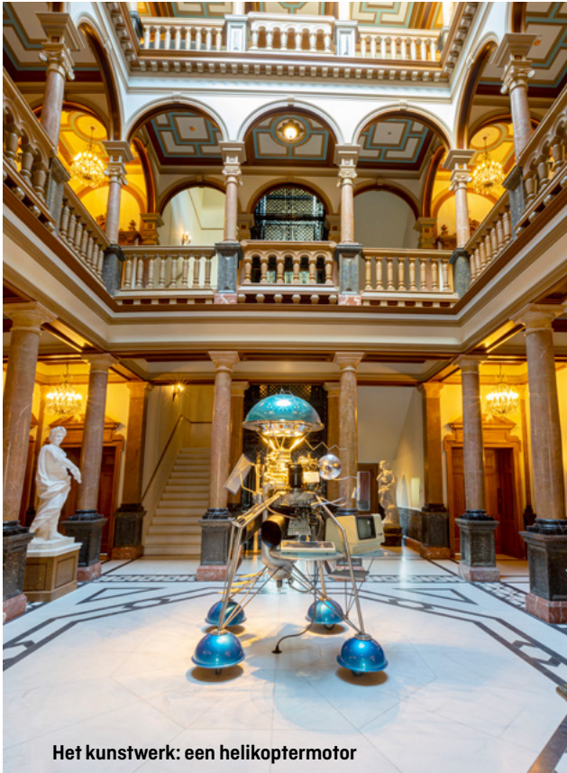
Het kunstwerk: een helikoptermotor

2003 mee met een handelsmissie. Kentie en Prins vlogen heel China door, 8.000 kilometer op zoek naar vaklieden die hen konden helpen. ‘We hebben zo-wat alle marmergroeven van China bezocht. Sjors en Sjimie in het Verre Oosten voelden we ons.’