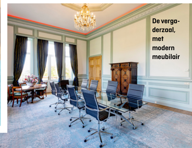
De vergaderzaal, met modern meubilair