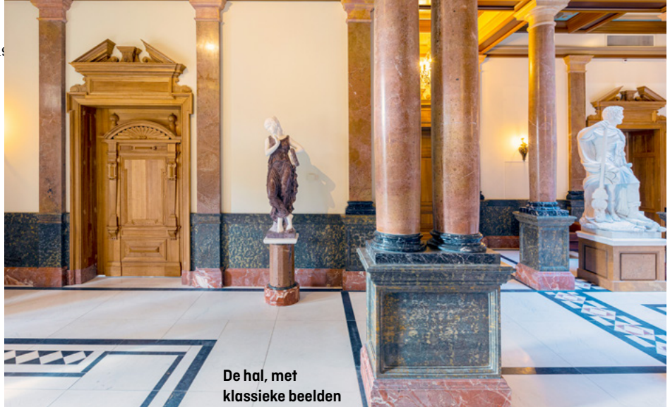
De hal, met klassieke beelden